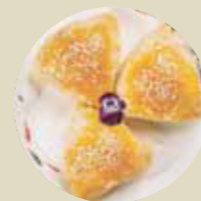
叉燒酥 BBQ PORK PIE, BÁNH NƯỚNG THỊT HEO BBQ-M