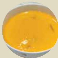
芒果布甸 MANGO PUDDING, PUDDING XOÀI-L