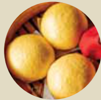
流沙飽 SALTED EGG YOLK BUN, BÁNH BÔNG LAN TRỨNG MUỐI -XL