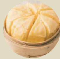
馬拉糕 SPONGECAKE, BÁNH XỐP-M