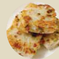
煎蘿卜糕 PANFRIED WHITE RADISH CAKE, BÁNH CÚ CÁI TRẮNG CHIÊN-L

PRICE GUIDES (MEMBER | GUEST) :S 小 $6.90,$7.80 |M 中 $8.90,$9.90 |L 大 $10.30,$11.30 XL 特 $10.80,$11.90 |XXL 頂 $12.90,$14.20 |XXXL 厨特 $16.30,$17.90