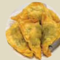
鮮蝦韭菜薄餅 PRAWN & CHIVE CAKE, CHIÊN GIÒN BÁNH TÔM VÀ TỎI TÂY TƯƠI-XL