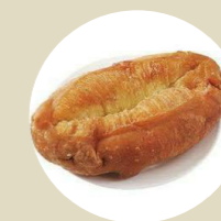
牛脷酥 CRISPY BUN BÒ GIÒN -