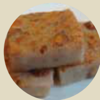
煎芋頭糕 PANFRIED TARO CAKE, BÁNH KHOAI MÔN CHIÊN-L