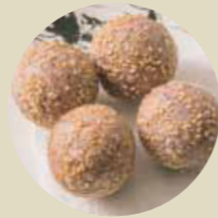
紫薯煎堆 PURPLE SWEET POTATO BALL, KHOAI LANG TÍM BI-M