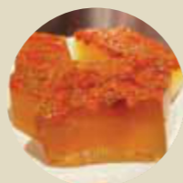
杞子桂花糕 HERBAL JELLY, THẠCH THẢO DỪC-M