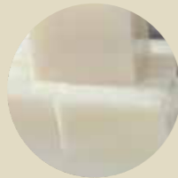
椰子果凍 COCONUT JELLY, THẠCH DỪA-M