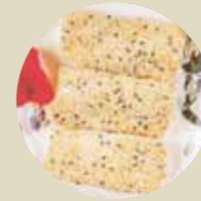
芝麻蝦卷 RICE PAPER PRAWN ROLL WITH SESAME, BÁNH TRÁNG CUỐN TÔM MÈ-XXL