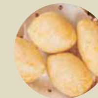
咸水角 FRIED COMBINATION DUMPLING, BÁNH BAO CHIÊN KẾT HỢP-L