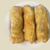
鮮蝦腐皮卷 SHRIMP TOFU SKIN ROLL DA ĐẬU HÔ TÔM CUỐN-XXL