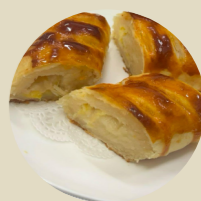
榴槤酥 CRISPY DURIAN CAKE BÁNH SẦU RIÊNG -