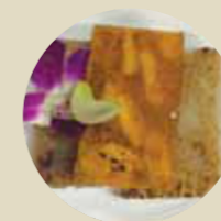
煎三色糕 FPAN FRIED MIXED PASTRIES BÁNH NGỌT HỖN HỢP CHIÊN CHẢO-L