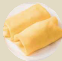
芒果班戟 MANGO PANCAKE, BÁNH XÈO XOÀI-L