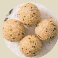
黑芝麻煎堆 BLACK SESAME BALL, MÈ ĐEN BI-M