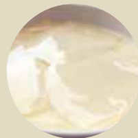
豆腐花 SILKY BEAN CURD WITH GINGER SYRUP, SỮA ĐÔNG MỀM VỚI GỪNG -S