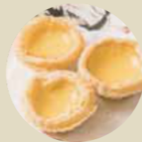
酥皮蛋撻 EGG CUSTARD TART, BÁNH TRỨNG SỮA-S