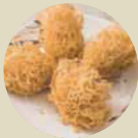
芋角 TARO DUMPLING, BÁNH BAO KHOAI MÔN-L