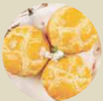
菠蘿奶黃飽 PINEAPPLE EGG CUSTARD BUN, BÁNH KEM TRỨNG DỪA-M