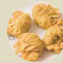
明蝦角 FRIED PRAWN DUMPLING, BÁNH BAO TÔM GIÒN-XXL